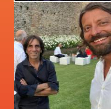
2 SETTEMBRE 2023 JUNGLE ACOUSTIC