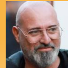
Stefano Bonaccini 30 Agosto